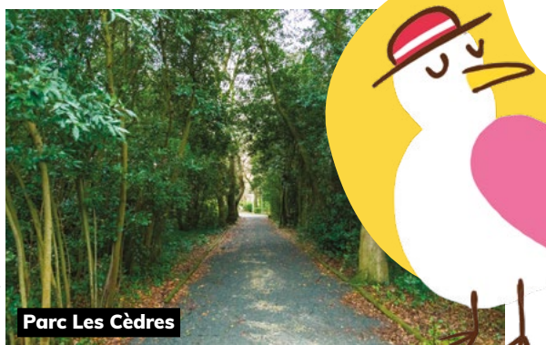
Parc Les Cèdres