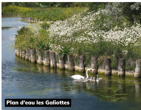
Plan d'eau les Galiottes