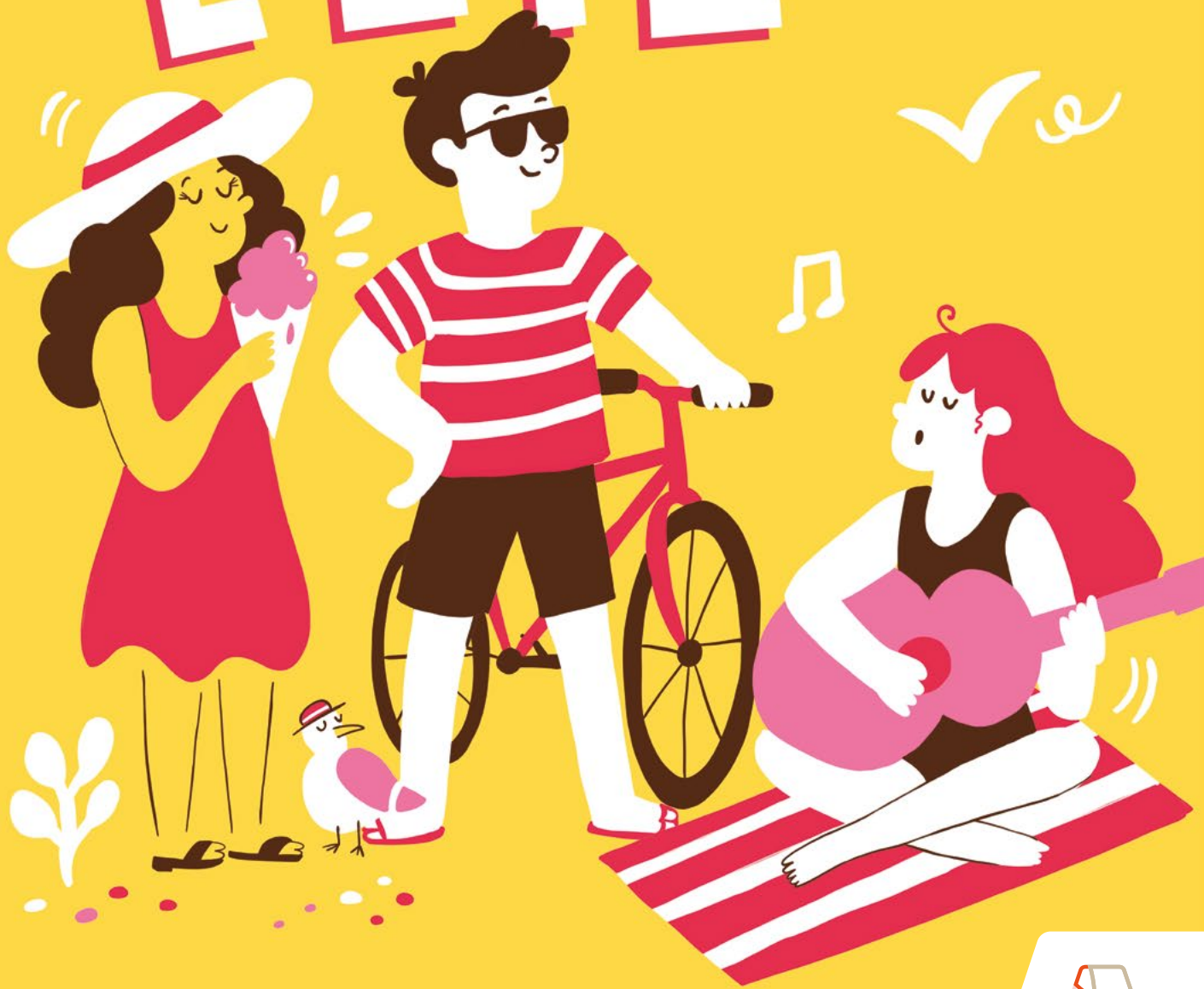
Illustration : Cathy Jho | Pôle communication, culture et événementiel, Mairie d'Aytré - Mai 2026